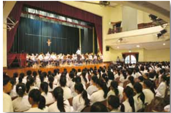
警察樂隊到本澳各校推廣音樂