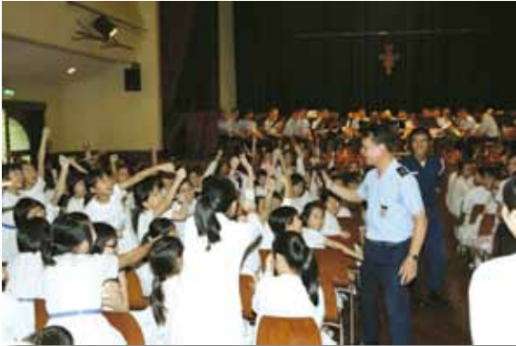
警察樂隊深受學生們歡迎

教育，培養本澳學生對音樂的興趣。於第三、四季度，樂隊分別到聖公會中學、海星中學、蓮峰普濟學校、聖羅撒中學、氹仔中葡及勞工子弟學校演出，贏得掌聲不絕之餘，亦推廣了本局的良好形象。