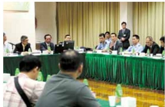
黃子暉副警務總長解答市民疑問

7月8日，由公共行政改革諮詢委員會主辦的“公共治安秩序與警民關係 - 探討簡化報案手續及流程座談會”假台山街市市政綜合大樓禮堂舉行。本局共派出3名代表參與，希望透過是次座談會廣泛聽取居民對簡化報案手續流程和促進警民關係的意見。會上，居民均積極地各抒己見，而本局亦認真聽取，並致力研究更多可行的具體措施以方便居民報案，藉以共同預防和打擊罪案。