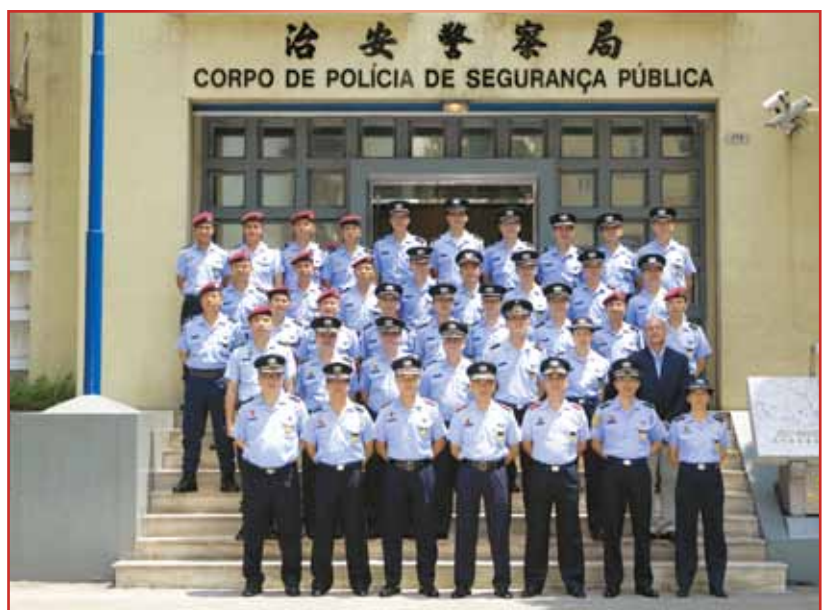
本局領導及部門主管與新晉警長合照