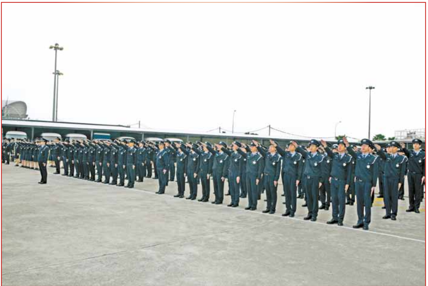
就職警員進行宣誓