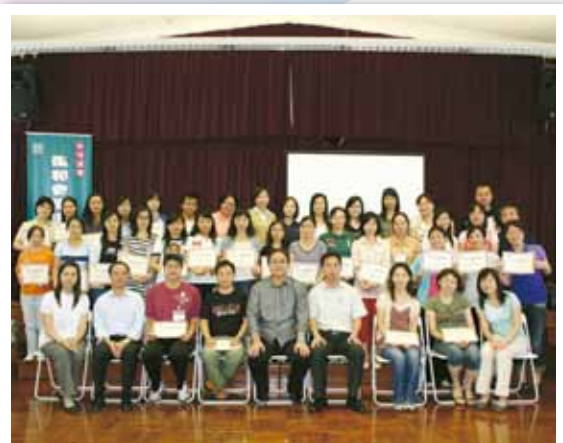
趙崇遠警司與參與課程人士合照

7月15日，本局應法務局之邀請，派員前往路環中葡學校，與由該局組織的教師一起出席「知法守禮」校園普法計劃之“復和會議主持人證書課程”，與參加該課程的教師分享執法時遇到與青少年接觸的經驗。