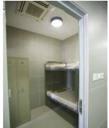
拘留中心共提供 16 個臨時收容房間

中心每層均有警員駐守，並透過閉路電視監控。拘留中心啟用後，本局會向司法機關建議將可按法律執行驅逐程序，未能在四十八小時內遣返原居地、或危害治安的非法入境者及非法逗留者拘留在該中心。