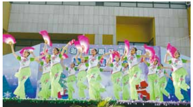
舞蹈組優美的舞姿