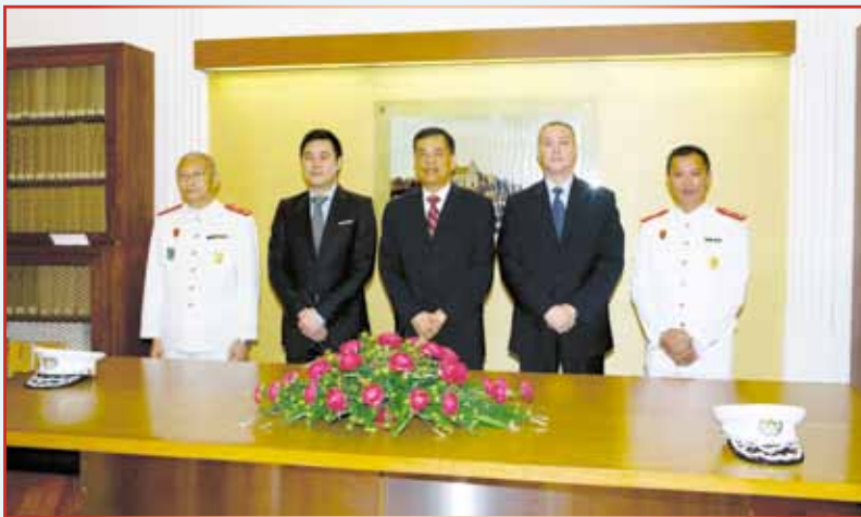
儀式由保安司司長主持

8月7日，本局局長李小平警務總監在保安司司長張國華警務總監、警察總局局長白英偉警務總監及保安司司長辦公室主任黃傳發先生見證下宣誓就職。儀式在保安司司長辦公室舉行，出席嘉賓包括海關關長徐禮恆先生、保安部隊各部隊的局級人員、本局各部門的廳長和負責人。