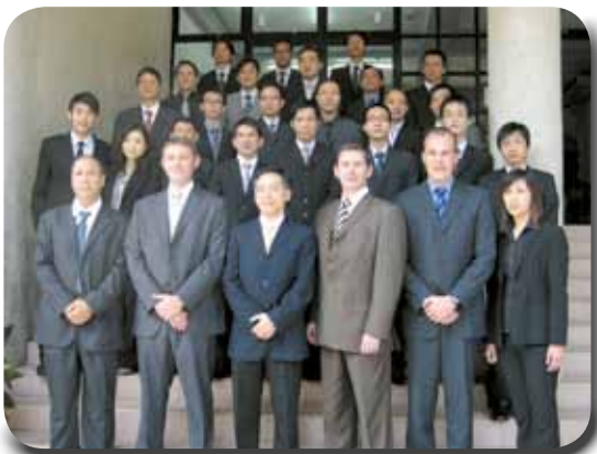
全體學員與課程導師合照

10月12日至23日，警察總局舉辦了毒品偵緝課程，特意邀請了來自法國巴黎司法警察局毒品偵查科的兩名警官，Louveau Xavier先生及Broch Vincent先生主講，本局共派出9名人員參與。課程由兩部份組成，導師於課程首週通過詳盡的講解，讓學員對海洛英、可卡因、大麻及安非他命類毒品有較深入的認識。其後，分析了當前世界的販毒市場的形勢和各國警方在打擊販毒問題所面對的難點。課程的第二部份為實踐練習，導師透過一宗模擬毒品交易案件讓學員認識法國警方對於情報收集、跟蹤搜證及拘捕等技巧。通過為期兩週的課程，學員們除學習對方偵防毒品犯罪的技巧外，亦分享了本地打擊毒品罪案方面的經驗，促進了兩地警務交流。