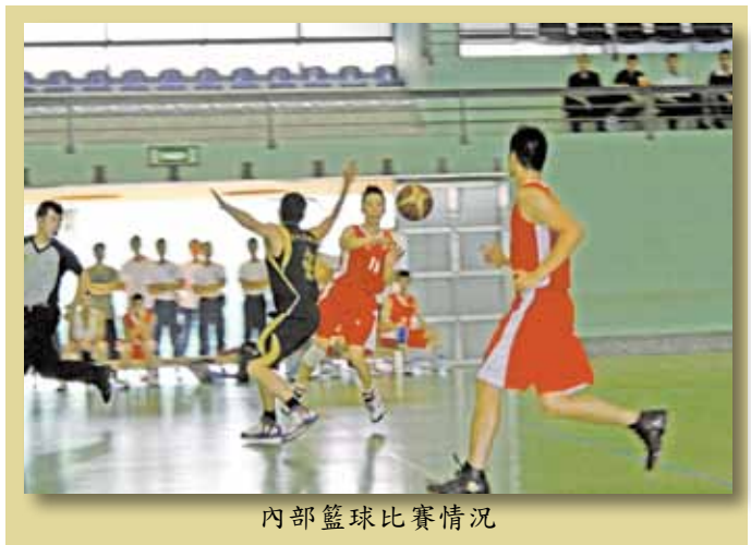
內部籃球比賽情況