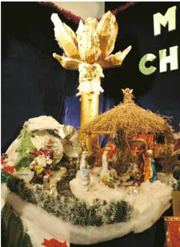
機場警務處的作品從眾多優秀創作中突圍而出