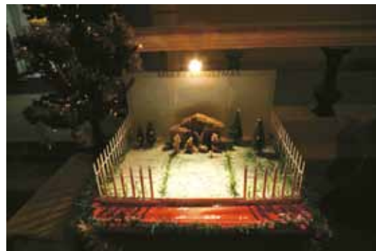
第二警務警司處作品