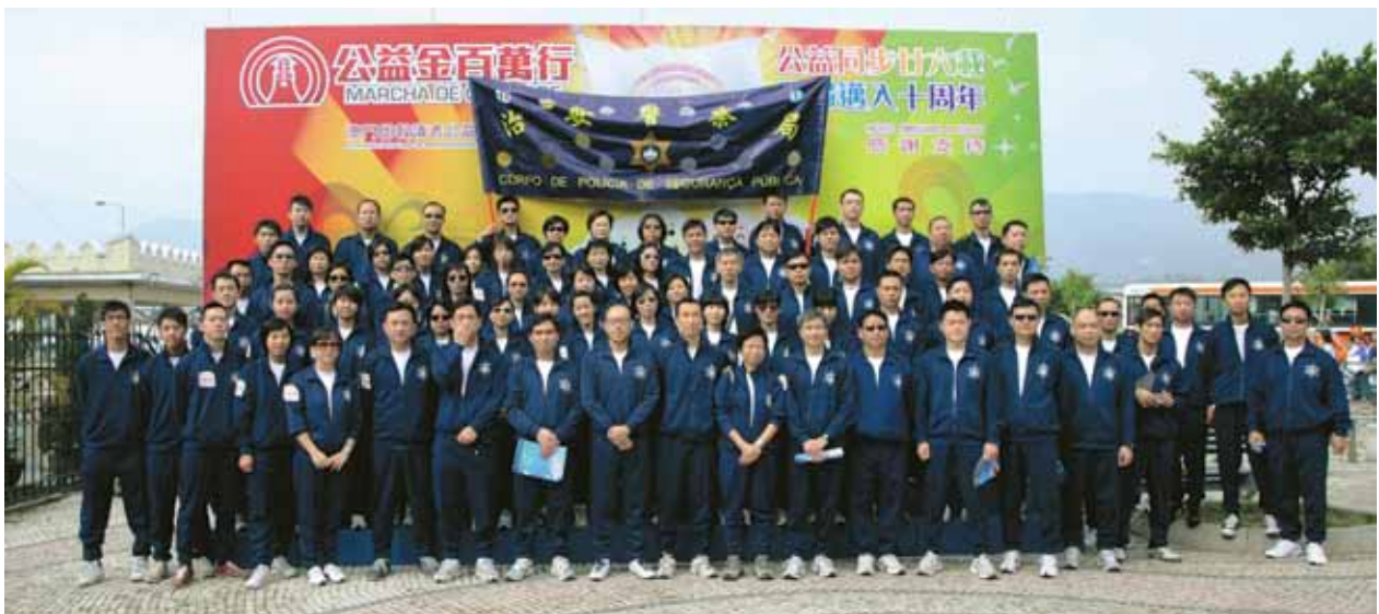
本局人員組隊參與百萬行善事