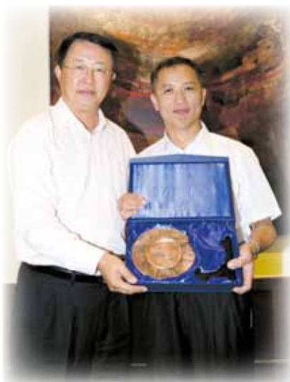
局長接受來訪者致送的紀念品

7月28至30日，深圳市副市長及市公安局局長李銘先生一行十二人到訪本局，並獲本局局長李小平警務總監、副局長馬耀權及毛傲賢副警務總監親自接待。於幾日的訪問活動中，來訪者主要就出入境事務範疇進行考察交流，探討了流動人口的管理、非法移民的打擊措施、涉外案件的處理和緊急意外的應變行動等等。