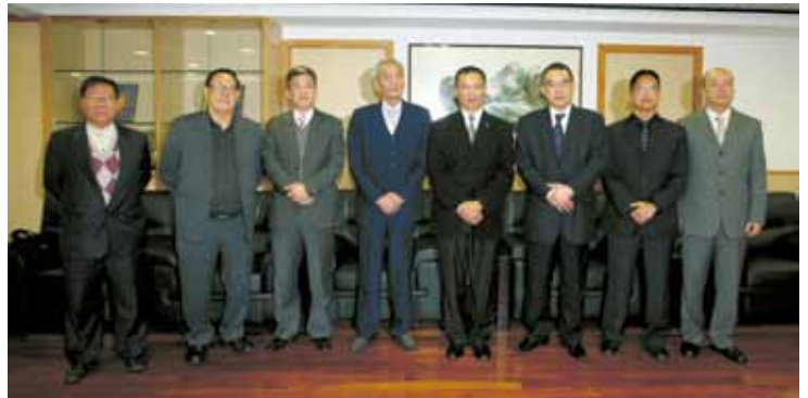
澳門日報讀者公益基金會到訪本局

於整個活動期間，本局銀樂隊為步行隊伍演奏多首百萬行歌曲及中外名曲，而巡邏警員及交通警員亦沿途負責百萬行的保安工作和維持交通秩序，令是次百萬行盛事得以圓滿完成。