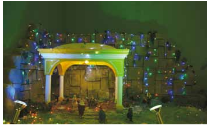
特警隊的作品贏得比賽第三名