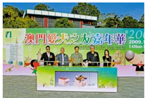
梁文昌警務總長出席活動並主持剪綵儀式

11月28日，民政總署假松山市政公園文娛廣場舉行“愛犬之友嘉年華2009”活動，由梁文昌警務總長代表本局出席。主辦單位希望藉攤位遊戲和表演節目宣揚愛護動物訊息，讓居民了解飼養寵物應有的責任和義務。活動安排了舞蹈、犬隻及警犬表演助興，場內還設攤位為犬隻注射防疫針、辦理牌照、領養寵物，獸醫團體為飼主提供諮詢服務等，吸引數百名居民帶同愛犬參與，分享養狗心得與樂趣，場面熱鬧。