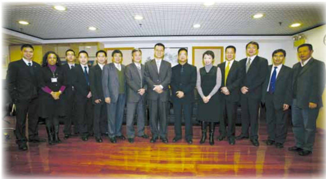
香港警務處聯絡事務科人員禮節性拜訪本局

12月9日，香港警務處聯絡事務科國際刑警中國香港許桂生總督察帶領該科人員一行六人禮節性拜訪本局，由行動廳廳長黎錦權警務總長、情報廳陳民德副警務總長及陳曉副警務總長接待。兩方人員在本局總部大樓舉行了座談會，會中雙方代表均表示希望兩地警務部門繼往開來，保持緊密合作及加強情報信息交流，共同打擊犯罪。