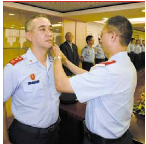
局長為副局長更換肩章

9月3日，在治安警察局總部貴賓室舉行了副局長毛傲賢副警務總監的就職儀式。儀式由局長李小平警務總監、副局長馬耀權副警務總監主持。出席儀式的還有局內各部門的廳長及負責人。