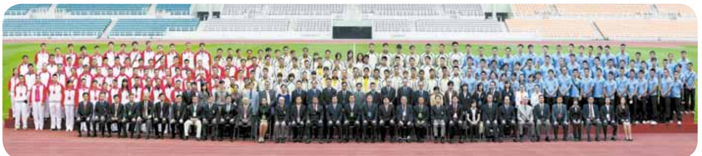
粵港澳三地警隊的體育精英大合照