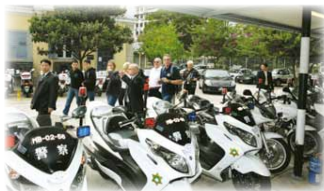
國際警察協會人員到訪交通廳