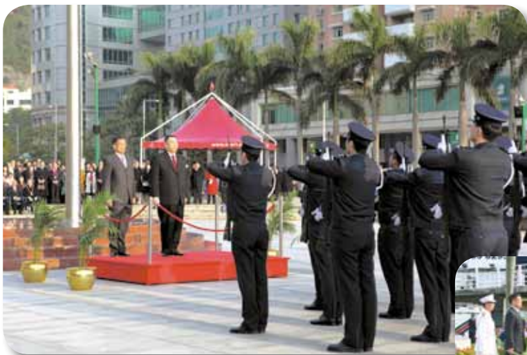
行政長官接受儀仗隊敬禮

10月1日及12月20日，為慶祝中華人民共和國成立六十周年及澳門特別行政區成立十周年，在新口岸金蓮花廣場舉行了莊嚴的升旗儀式。於國慶紀念日和回歸紀念日當日，升旗儀式分別由前任行政長官何厚鏞先生及現任行政長官崔世安先生主持，在保安司司長張國華警務總監陪同下檢閱了由警察樂隊、海關、治安警察局及消防局組成的儀仗隊；隨後，由兩個特警隊中隊組成的護旗隊進場，個個精神抖擻、邁著鏗鏘有力的一致步伐操向升旗台，在銀樂隊奏出雄壯的國歌下，國旗及區旗冉冉升起，隨風飄揚。最後，儀式在儀仗隊列隊行進，向行政長官及各出席嘉賓致敬後結束。