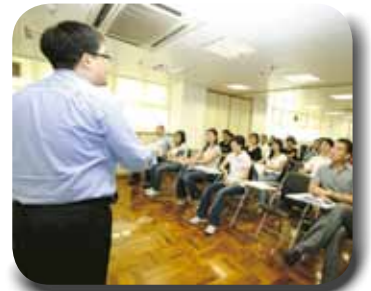
本局人員細心聆聽導師講解

為配合服務承諾的推行，持續提升服務質素，於7至8月期間，本局繼續開辦了第三及第四班優質服務進階課程，每班12課時，共為本局51名人員提供了培訓。課程目的在於加深負責監督服務承諾計劃的主管人員對優質服務核心價值的理解及該計劃管理方法的掌握，有關課程透過品質管理／服務承諾認可度的評審機制，介紹管理服務承諾項目及達至持續改善的實務方法和工具，以及分享政府部門在推行服務承諾過程中遇到的問題和解決方法等。