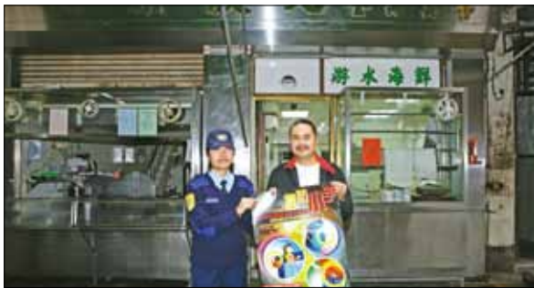
本局人員派發宣傳海報

針對扒竊案件較去年同期有所上升，本局除了加強打擊力度外，亦特別為此印製了“提防小手”系列宣傳品向市民和遊客宣傳和提高其保護個人財物的意識，包括海報、小冊子及餐牌座等。本局公共關係處及各警務警司處人員分別於7至12月期間多次到各警區範圍內之住宅、食店及商舖等地點張貼和派發有關宣傳品，宣傳預防犯罪的同時，亦鼓勵上述地點的負責人如發現任何犯罪行為，應儘快向本局報舉，藉以宣揚警民合作的訊息。