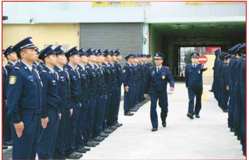
局長檢閱新晉警員隊伍

159名就職的警員中，12名具大學學歷，兩名具大專學歷，109名具高中學歷，其餘36名具初中學歷。