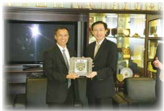
局長向代表團致送紀念品

8月13日，上海市公安局副局長陳臻率領八人的代表團到訪，與本澳警務部門舉行了滬澳警務合作第七次工作會晤。會晤中，雙方就滬澳刑偵合作範疇進行了深入的探討，研商加強涉及兩地違法犯罪情報信息通報及個案協作的工作措施，包括開展跨境有組織犯罪、毒品犯罪及經濟犯罪的情報信息交流及打擊、防範措施。會議加強了兩地警務部門的交流，並於坦誠友好的氣氛下圓滿結束。