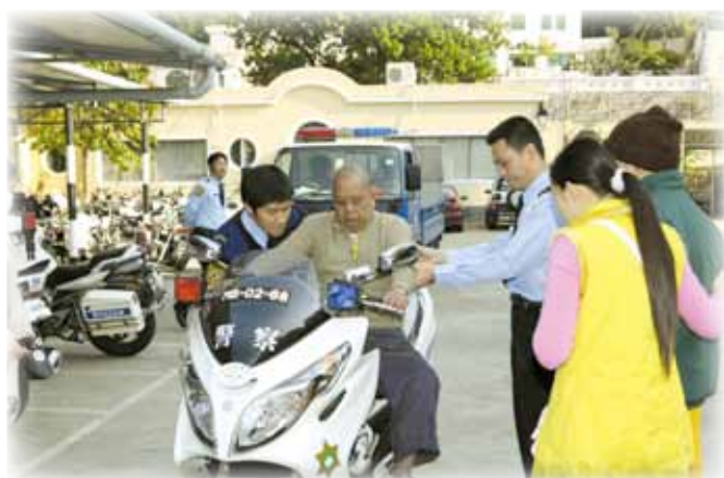
長者們坐上巡邏電單車拍照留念

另外，伯大尼安老院及國際警察協會亦分別於11月24日及26日到交通廳參觀訪問，由歐維士副警務總長及張映順警司等負責接待。該廳人員除了向來訪者展示裝備及介紹日常運作外，亦讓公公婆婆坐上巡邏電單車上拍照留念，逗得長者們滿心歡喜。