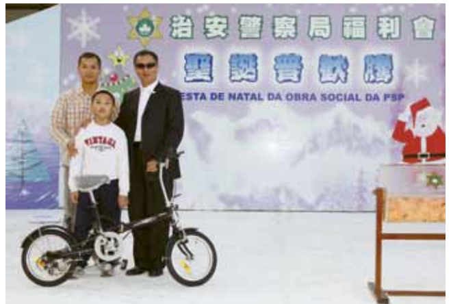
局長抽出豐富獎品予幸運兒

是次活動的表演節目可謂極盡視聽之娛，警察樂隊在台上舉行了小型音樂會，演奏及演唱了多首悅耳的應節樂曲。警察舞蹈組表演兩支名為“俏蘭花”及“舞動驕陽”的精彩舞蹈，舞姿優美，贏得了全場熱烈的掌聲！另外，亦邀請了澳門歌手陳健華與小朋友合唱，精彩節目一浪接一浪。最後，壓軸的大抽獎環節將全場氣氛推至最高點，中獎的小朋友們興高采烈，歡呼聲不絕於耳。本年度的聖誕聯歡活動就在一片歡樂中圓滿結束。