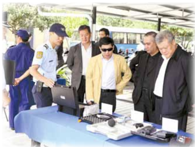
交通廳人員向深圳市代表團展示電子儀器

11月6日及12月11日，深圳市人大、深圳市交通部，以及佛山市公安局代表團到訪本局交通廳，由副局長毛傲賢副警務總監及黃沛華警務總長熱情接待。整個訪問活動中，本局人員向來訪者介紹了本局的架構及運作，展示了交通廳常規裝備及設施，並就兩地的交通事務方面遇到的問題進行研究探討，各自分享了對方成功的經驗。