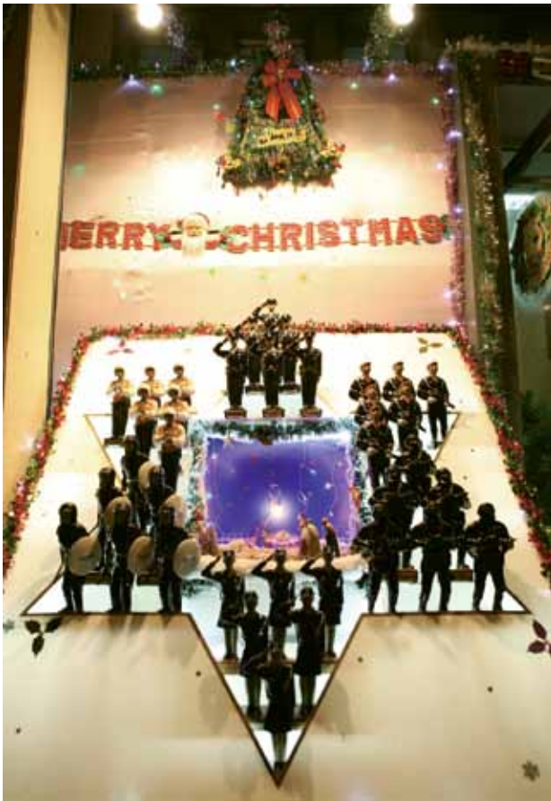
第三警務警司處作品取得比賽第二名及創作獎