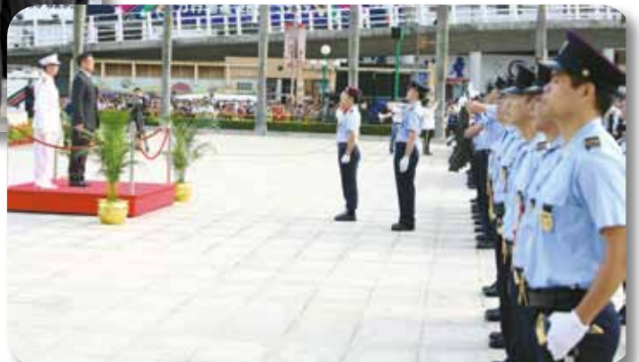
保安司司長接受儀仗隊敬禮