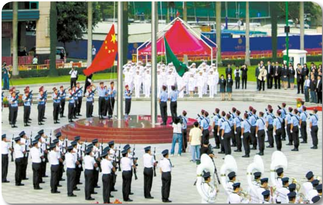
國旗在莊嚴的儀式下冉冉升起

10月1日及12月20日，為慶祝中華人民共和國成立六十周年及澳門特別行政區成立十周年，在新口岸金蓮花廣場舉行了莊嚴的升旗儀式。於國慶紀念日和回歸紀念日當日，升旗儀式分別由前任行政長官何厚鏞先生及現任行政長官崔世安先生主持，在保安司司長張國華警務總監陪同下檢閱了由警察樂隊、海關、治安警察局及消防局組成的儀仗隊；隨後，由兩個特警隊中隊組成的護旗隊進場，個個精神抖擻、邁著鏗鏘有力的一致步伐操向升旗台，在銀樂隊奏出雄壯的國歌下，國旗及區旗冉冉升起，隨風飄揚。最後，儀式在儀仗隊列隊行進，向行政長官及各出席嘉賓致敬後結束。