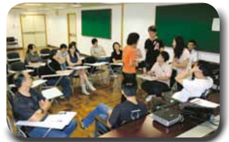
學員在進行投訴個案模擬練習

本局於9月上旬開辦了電話接待及處理投訴技巧課程，共為43名人員提供了約36小時的專業培訓。課程的對象主要是本局專責接待公眾來電的行動暨控制中心及其他前線警務人員。通過導師許國杰先生悉心詳盡的講解和互動練習，學員可以進一步掌握電話接待的正確技巧，並瞭解到引致投訴的真正原因，以及有效減少投訴的方法和必備知識。