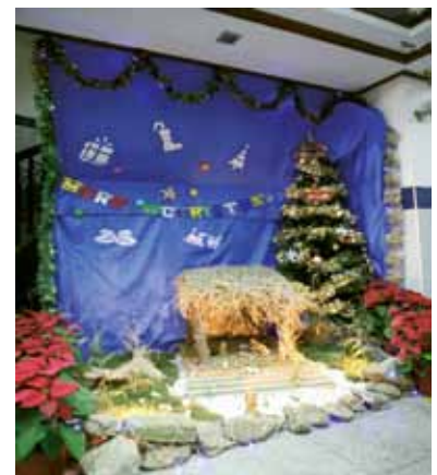
氹仔警務警司處作品