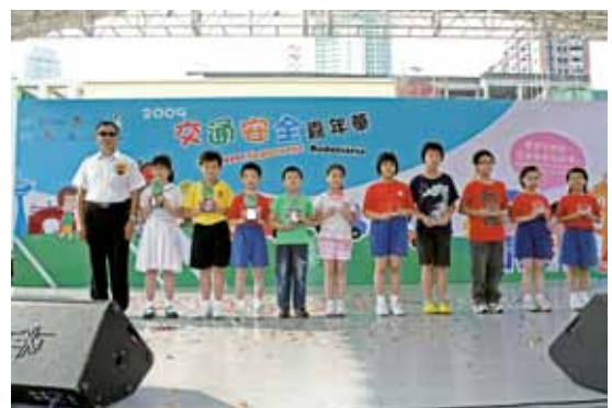
局長與獲獎小朋友合照

10月31日下午，由交通事務局、法務局、民政總署及本局合辦的交通安全嘉年華假塔石廣場舉行，標誌着本年度交通安全推廣月活動正式展開。是次活動主題為“齊齊守規則、交通安全我記得”，活動節目內容包括有舞台表演、攤位遊戲、展覽區、大抽獎等；同時亦舉行了“兒童創意填色比賽”及“青少年創意攤位遊戲設計比賽”頒獎儀式。各主辦單位希望藉着一年一度的大型推廣活動，向居民推廣交通安全訊息，鼓勵居民自覺守法，共同營造一個安全、禮讓和暢通的交通環境。