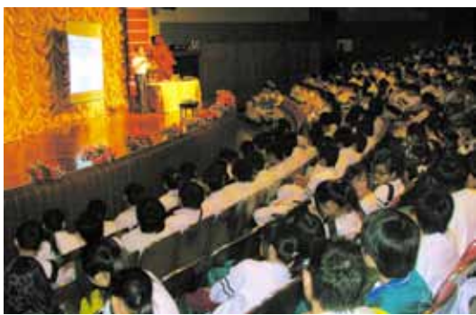
公共關係處人員到學校進行講座

於本年11月13日，本局公共關係處人員應聖若瑟中學邀請進行一場“預防青少年犯罪”講座，約三百名學生參與，期間學生們積極踴躍發問，形成良好的互動。