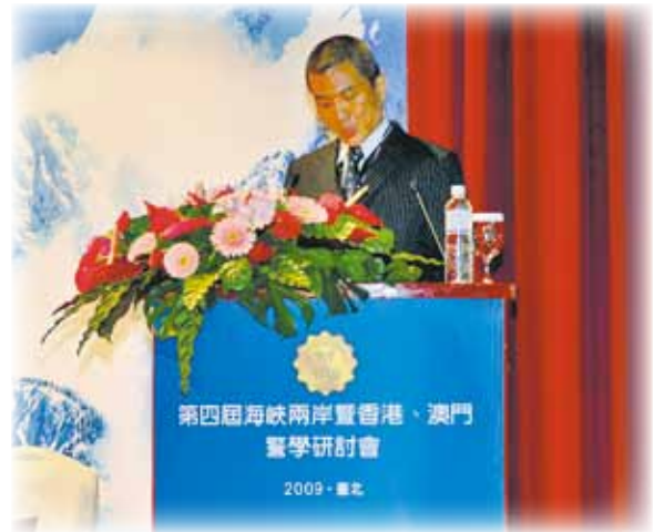
警察學校校長謝偉副警務總長發表論文

是次警學研討、交流和考察活動，大大加深了澳門與內地、台灣及香港警界同僚間的了解和情誼，推動了海峽兩岸四地的警務合作，進一步為兩岸四地共同打擊跨境犯罪打下穩固的基礎。