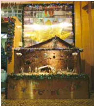
第一警務警司處作品