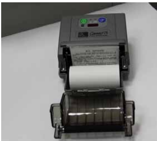
掌上型電腦終端機